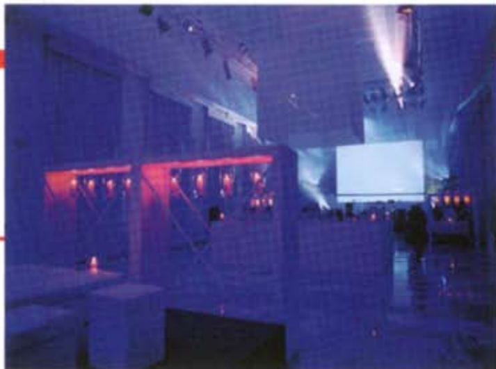
H.D. Eventi è in grado di allestire ambienti diversi, per tipologie differenti di eventi. Sopra, una scenografia suggestiva.